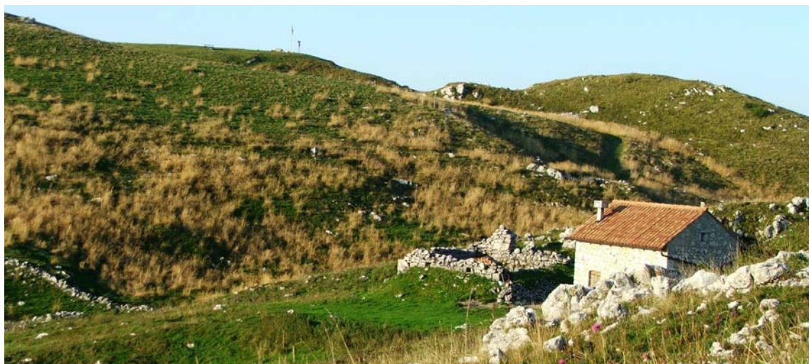
Valico Monte Pizzoc

Nel trevigiano i siti di particolare valore, studiati negli ultimi cinque anni, sono stati: il valico del Monte Pizzoc (Cansiglio Meridionale, Fregona) e la Forcella Mostaccin (Maser). Entrambe le aree si caratterizzano per un passaggio elevato di uccelli nelle prime ore della mattina, poi il flusso si riduce nel pomeriggio. Solo nelle giornate di maggiore passaggio si può osservare un flusso quasi continuo in tutte le ore, arrivando a superare le 8-9 mila unità. La stima totale per anno è di 50.000-90.000 uccelli (Mte Pizzoc) e 20.000-60.000 (Forcella Mostaccin) .